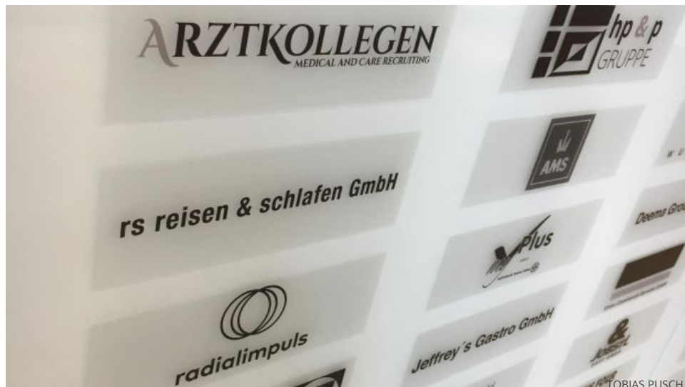
Firmenschilder am Sitz von Reisen &amp; Schlafen in Hamburg

Mit Hunderten Abmahnungen gegen Reisebüros machte sich die Reisen & Schlafen GmbH seit dem Vorjahr einen Namen in der Branche. Doch nun gibt es für die abkassierten Agenturen Hoffnung: Das Landgericht Frankfurt hat einen Beschluss veröffentlicht, der an Deutlichkeit nichts zu wünschen übrig lässt.